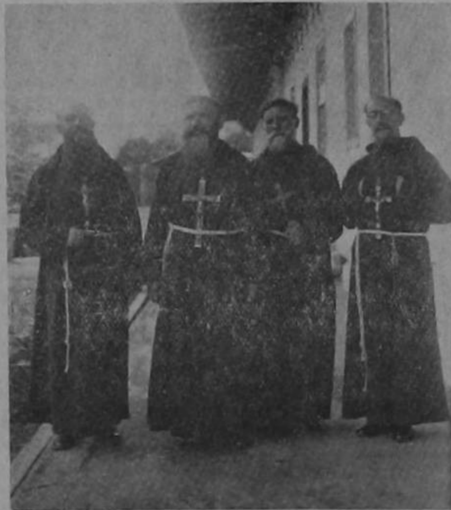
Padres Misioneros Capuchinos que predicaron la Misión en el Santuario de Nuestra Señora de los Angeles

El domingo día 7, por la mañana, después de la Misa solemne, salió la procesión del Corpus, que también fué como manifestación piadosa del último día de la Misión, llevándose en la misma el estandarte de la Divina Pas-